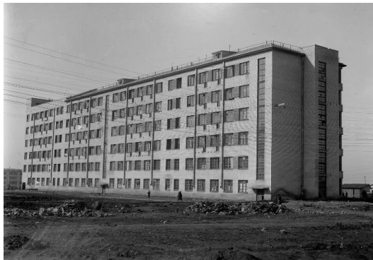
Фото 3. Шестиповерховий будинок для самотніх робітників Харківського тракторного заводу ім. С. Орджонікідзе, 1932 р..

«максимально усупільненим культурно-побутовим обслуговуванням населення». Квартири були запроєктовані без кухонь, бо вважали, що робітники неодмінно будуть харчуватись у їдальнях [34].